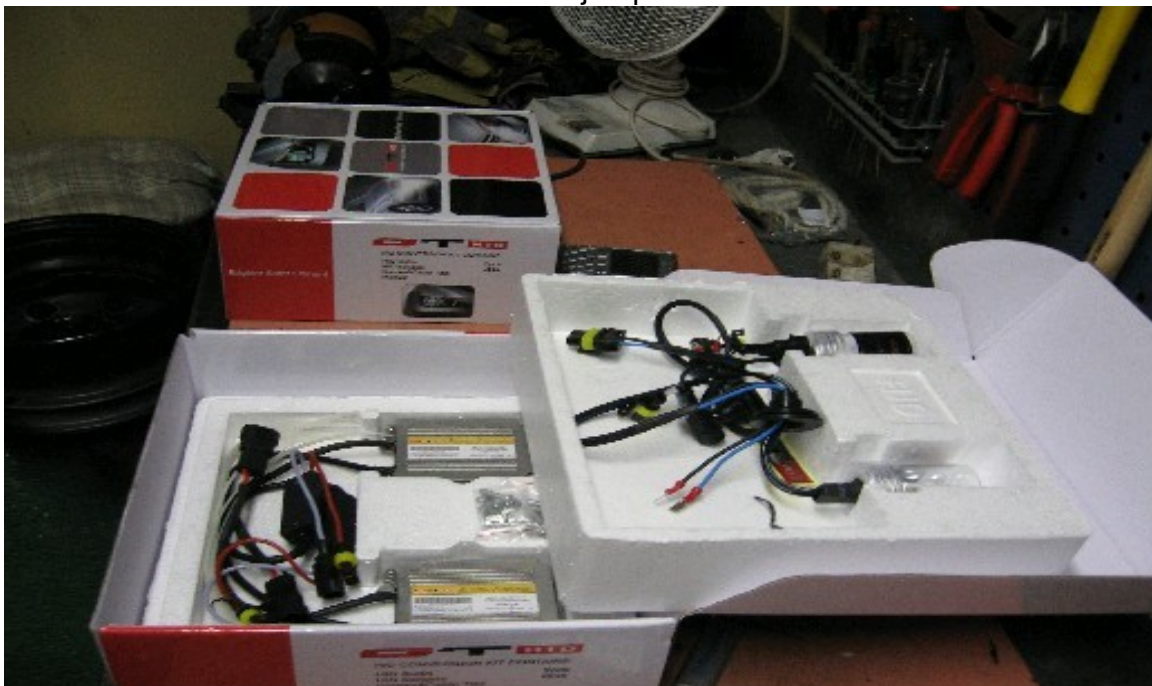
Kuva.1 Xenonvalojen paketit.

Kaikki muutokset tietysti teette omalla vastuulla!!!!