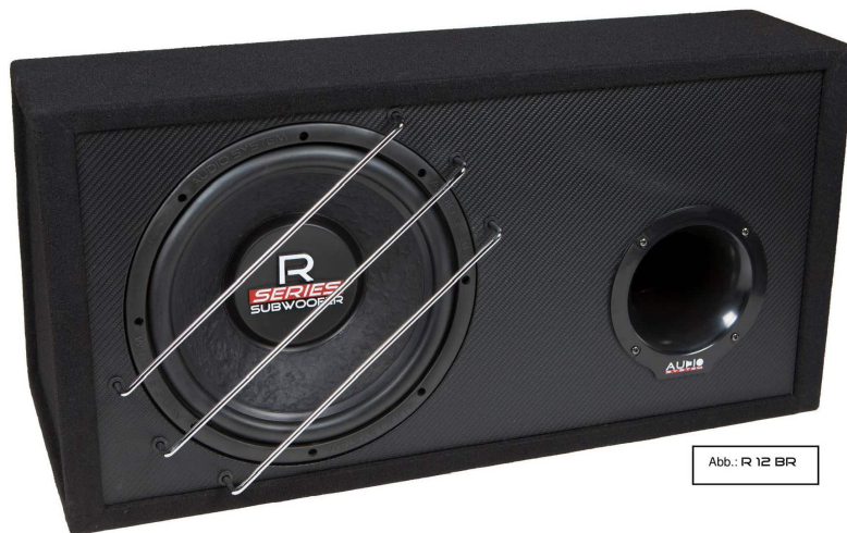
Abb.: R 12 BR

R-SERIES WOOFER BOX ANLEITUNG / USER MANUAL