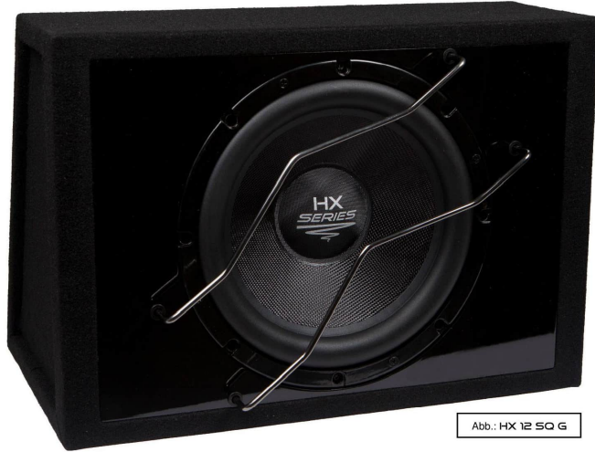
Abb.: HX 12 SQ G